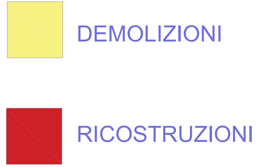
STATO MODIFICATO PIANO PRIMO scala 1:100