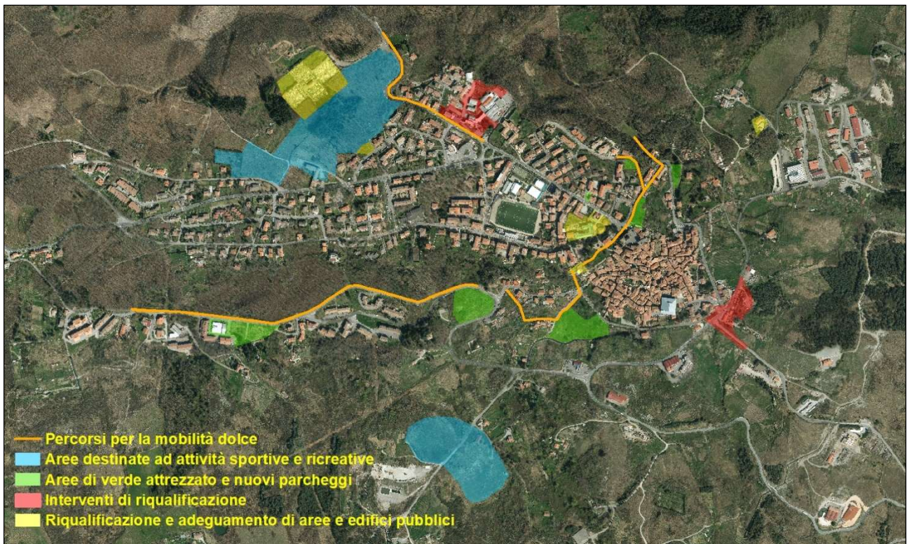
Schema planimetrico del progetto organico degli interventi pubblici previsti nel capoluogo.

Coerentemente con gli obiettivi prefissati, il PO ha assunto il compito di definire un progetto integrato del sistema dei servizi e degli spazi pubblici in termini di Parco urbano , che comprende: