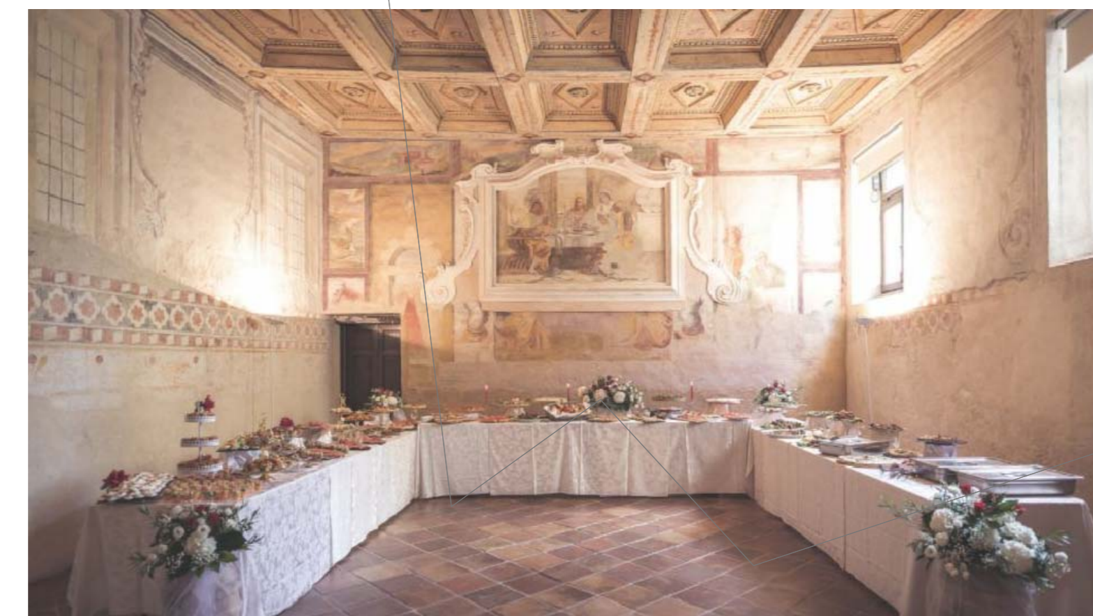
8. sala capitolare