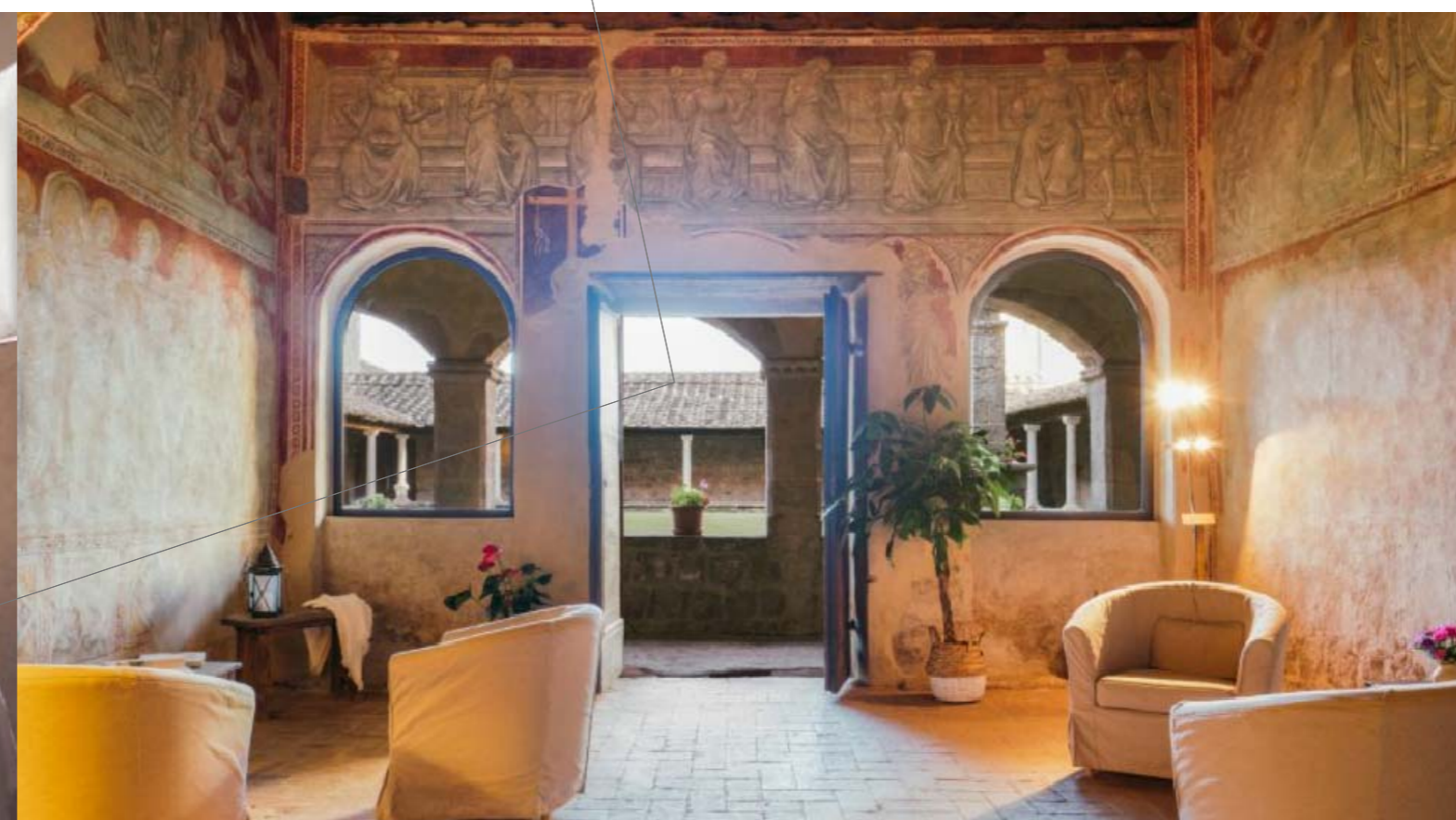
9. sala dei santi